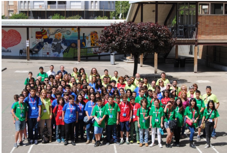
1: Participants fase final FEM Matemàtiques 2015

Els 3 alumnes guanyadors de la fase final catalana són els representants de Catalunya a la Olimpíada Matemàtica Espanyola organitzada per la FESPM (Federación Española de Sociedades de Profesores de Matemáticas): http://www.fespm.es/-Olimpiada-Matematica-