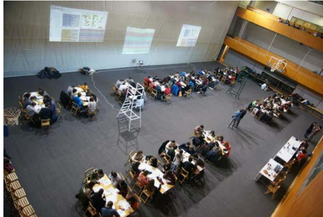
3 Poliesportiu de la UPC on es va celebrar la final catalana

Podeu trobar tota la informació de l'activitat a: http://www.cangur.org/la-copa/